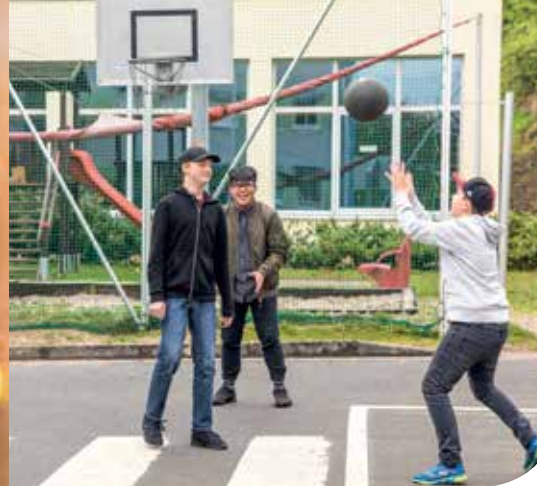
Freizeitaktivitäten unterstützen den Therapieerfolg. Dazu gehören Sportarten wie Basketball oder Fußball aber auch ein Spielplatz für die Kleinen.