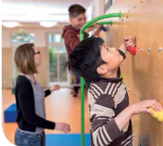
Jeder sucht seine eigene Herausforderung und wächst daran – ob in der Sprachtherapie oder beim Sport.