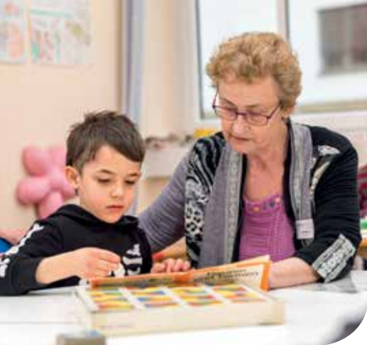
Die begleitende Förderung im Gruppenalltag erleichtert die Übertragung der Therapieinhalte in die Alltagssprache.